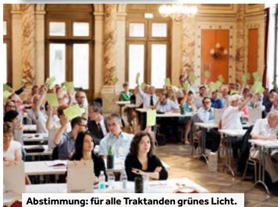
Abstimmung: für alle Traktanden grünes Licht.