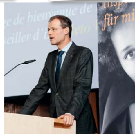
Regierungsrat Reto Wyss: partnerschaftlich.