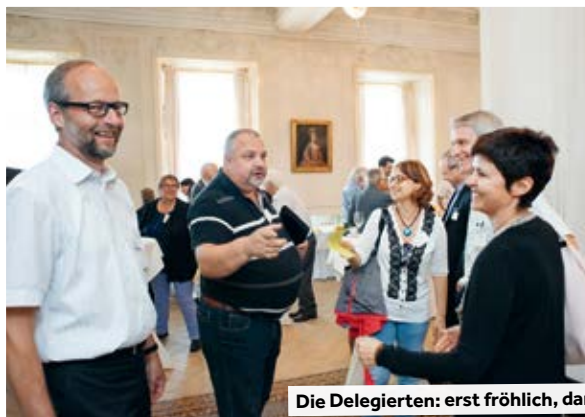
Die Delegierten: erst fröhlich, dann ernst zur Tat schreitend.