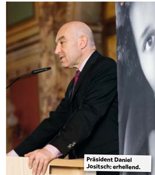
Präsident Daniel Jositsch: erhellend.

Ich tausche mich regelmässig mit Fachleuten und anderen CEOs aus. Ich besuche Veranstaltungen und Kongresse. Intern organisieren wir Klausuren und Trendforschungsanlässe, zu denen wir externe Referenten einladen. Wenn immer möglich gehe ich auch an unsere internationale Handelstagung. Die Schulbank drücke ich aber nicht mehr, ich absolviere keine Lehrgänge mehr. Für mich ist der Austausch wichtig.