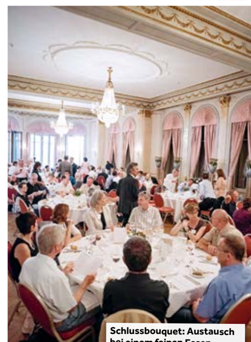
Schlussbouquet: Austausch bei einem feinen Essen.