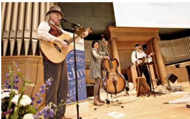
Musikalisches Zwischenspiel: Gumboot Rednex.