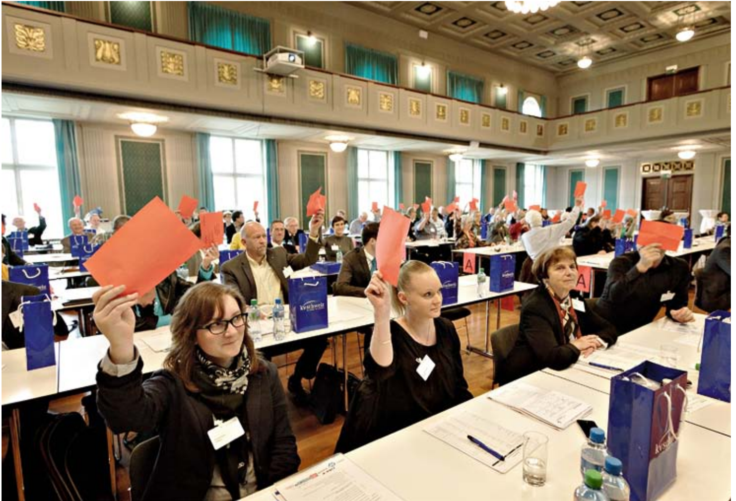
Weitgehende Zustimmung: 74 Delegierte waren in Winterthur anwesend.

Am 1. Juni 2013 fand die Delegiertenversammlung des KV Schweiz in Winterthur statt. Die Delegierten verabschiedeten eine Resolution, wonach Bankangestellte vor ungerechtfertigter Strafverfolgung zu schützen sind. Text Therese Jäggi